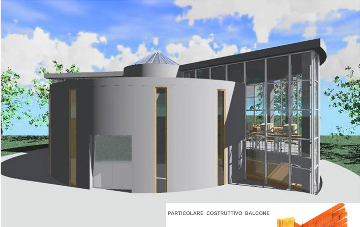
PARTICOLARE COSTRUTTIVO BALCONE